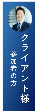
クライアント様 参加者の方